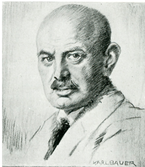
Dietrich Eckart (1868–1923)

In dem Schwabinger Weinlokal saß der Dichter Dietrich Eckart. Er stammte aus Neumarkt in der Oberpfalz, „war ein mittelgroßer dicker Mann mit einem eindrucksvollen Kahlkopf, einem tiefen Bass und etwas kleinen Augen, der bayrische Kraftausdrücke und einen guten Tropfen liebte.“ (Konrad Heiden)